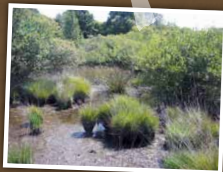
Assèchement et envahissement d'une mare par les saules.

Information et sensibilisation des usagers Mise en place d'inventaires scientifiques