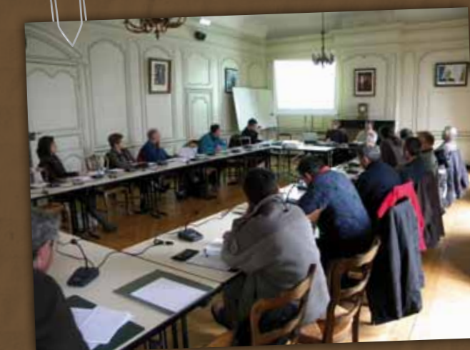
Réunion du Comité de pilotage pour la validation du Docob.

Lamballe Communauté, en partenariat avec la Ville de Lamballe, a été choisie pour animer le comité de pilotage et désignée "opérateur Natura 2000 pour la rédaction du Docob".